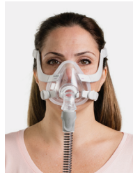
Mascarilla de rostro completo