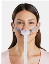
Mascarilla de almohadilla nasal